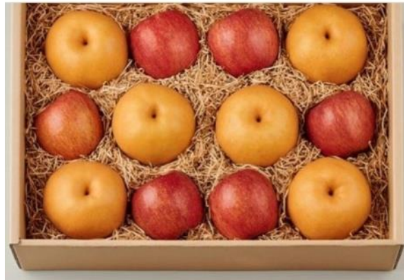
ภาพชุดผลไม้ของขวัญจาก Lotte-mart

ด้าน Lotte-Mart ใช้กระดาษแทนพลาสติกและโฟม ในการห่อชุดผลไม้ของขวัญ โดยบริษัท Dongwon F&B ก็ยังเปิดตัว บรรจุภัณฑ์ที่เป็นกระดาษทั้งชิ้น หรือ ‘All-paper Package’ ในการห่อชุดของขวัญในปีนี้ จึงทำให้บริษัท Dongwon F&B สามารถลดการใช้พลาสติกในการห่อชุดของขวัญได้ถึง 10% และยังสามารถลดขยะพลาสติกได้ถึง 75 ตันต่อปี