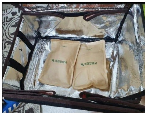
รูปภาพบรรจุภัณฑ์แบบสามารถใช้ซ้ำได้ของ Coupang

โดยทางกระทรวงทรัพยากรธรรมชาติและสิ่งแวดล้อมคาดการณ์ว่า จะสามารถประหยัดกล่องกระดาษได้ 133,000 กล่อง และลดขยะได้ถึง 66 ตัน ใน 1 ปี อีกทั้งยังกล่าวว่า หลังจากนี้ 1 ปี พวกเขาจะขยายการสนับสนุนเช่นนี้แก่เมืองอื่นๆ หลังจากได้รับการประเมินแล้ว