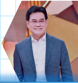
นายจรินทร์ ลักษณวิศิษฏ์ (รองนายกรัฐมนตรีและรัฐมนตรีว่าการกระทรวงพาณิชย์) ประธานกรรมการ